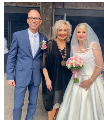
Svatební obřad v Dolních Vítkovicích.