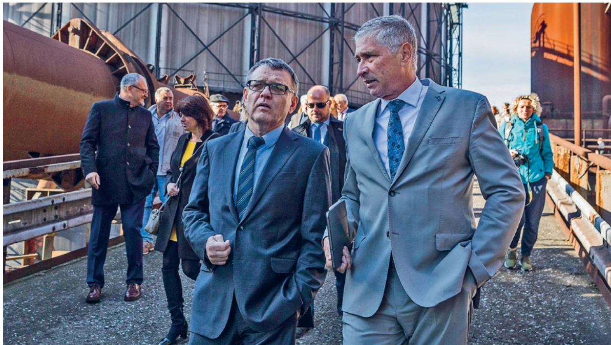
Ministr kultury ČR Lubomír Zaorálek a hejtman Moravskoslezského kraje Ivo Vondrák navštívili Dolní Vítkovice.

V Dolních Vítkovicích vznikne nová příspěvková organizace státu. MUSEUM+ využije sbírky národních muzeí a prostřednictvím originálních exponátů seznámí návštěvníky se světem přírody, historie, techniky, designu a umění. MUSEUM+ vznikne revitalizací vysokých pecí číslo 4 a 6, které jsou součástí národní kulturní památky Dolní Vítkovice.