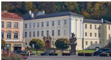
Plný barokních perel je například Fulnek.

Přednášky v rámci studia Virtuální univerzity 3. věku.